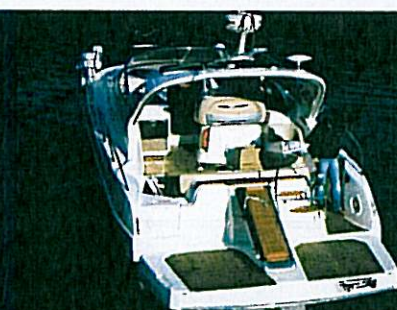
CRANCHI ZAFFIRO 36 pag. 58