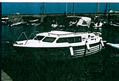
JAVAZZO JODA 7500 pag. 45