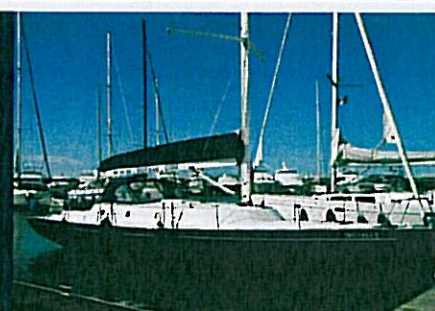
DOTS 48 pag. 81