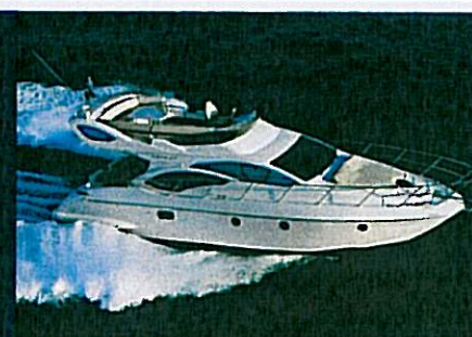
AZIMUT 43 FLY pag. 61