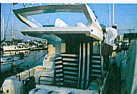
GALEON 290 FLY pag. 64