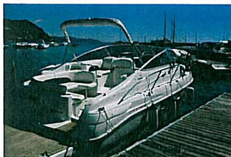
CRANCHI ZAFFIRO 28 pag. 40

BARCA DEL MESE: NOVITA' OPEN KOOT 54 Pag. 22