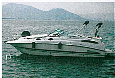
REGALE MARINE 2565 WINDOWS EXPRESS pag. 60