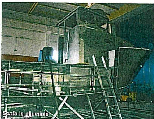
Scafo in alluminio

Il tutto in linea con una filosofia aziendale che ha un unico obiettivo: garantire soluzioni intelligenti per l'industria, professionalità di alta qualità, un servizio di pronto intervento attivo su territorio internazionale 24 ore su 24.