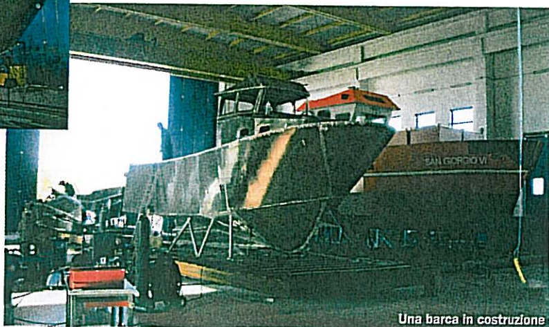
Una barca in costruzione